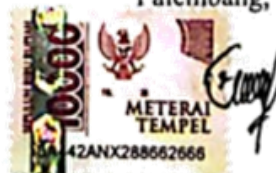
Nur Nabila Virawati