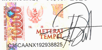
Riska Nurul Azmi