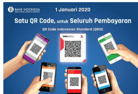
Gambar 1.2 Contoh QRIS