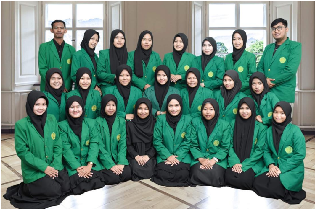
Teman-teman Seperjuangan Tarbiyah Angkatan 2019