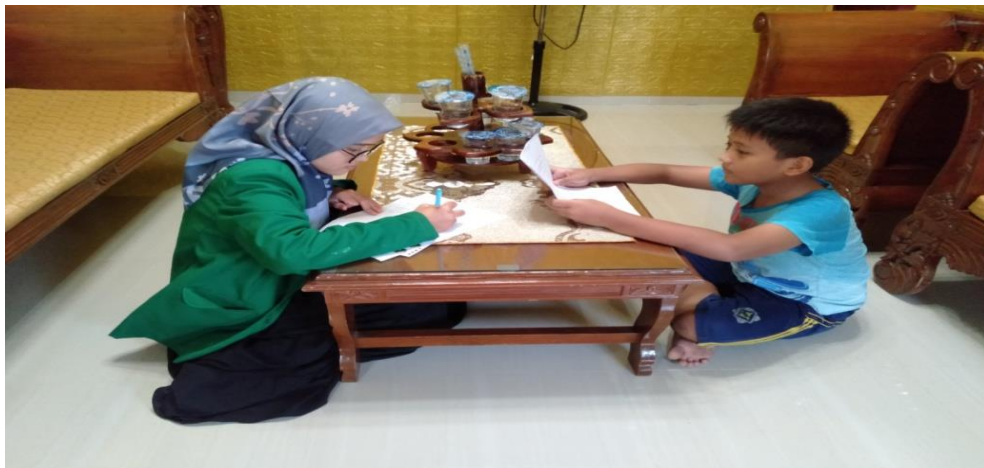
Wawancara Penliti Dengan Anak Fathur Al-Fatih