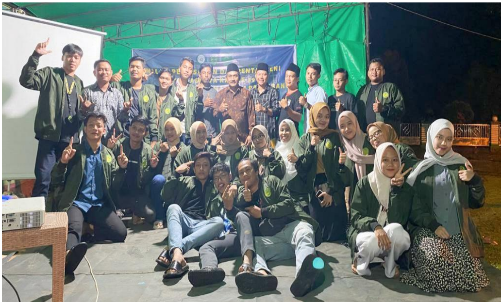
Teman-teman Seperjuangan KKN-59 Posko 117 dan 118 UMP