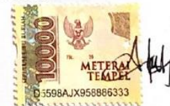
Febri Yanti Anggraini