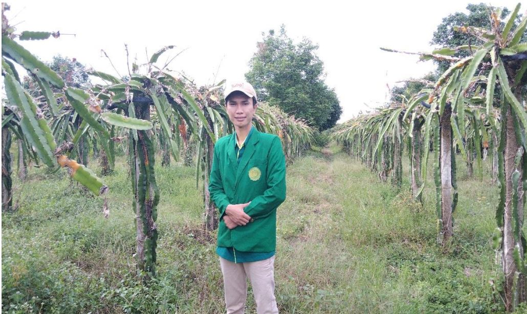
Gambar 5. Kebun Buah Naga Merah