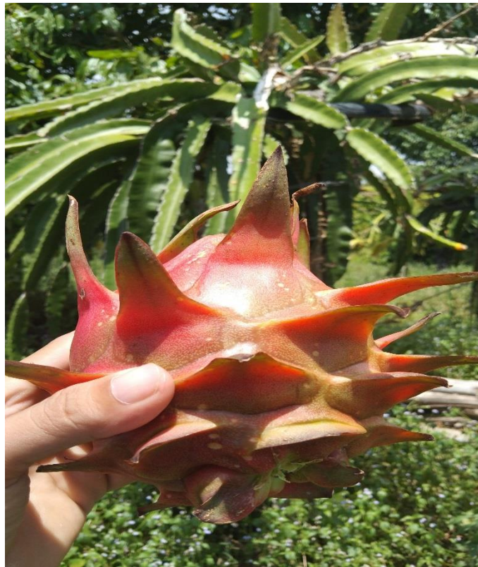
Gambar 3. Bunga Dan Buah Naga Merah