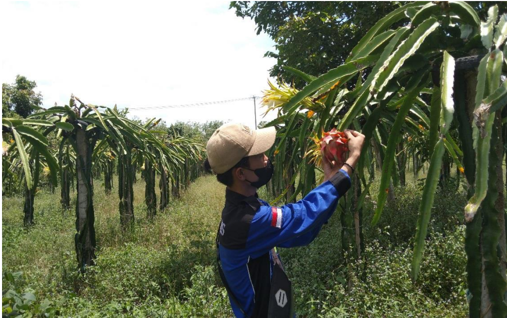
Gambar 4. Panen Buah Naga Merah