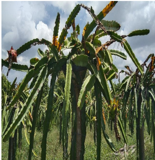
Gambar 2. Tanaman Buah Naga Merah