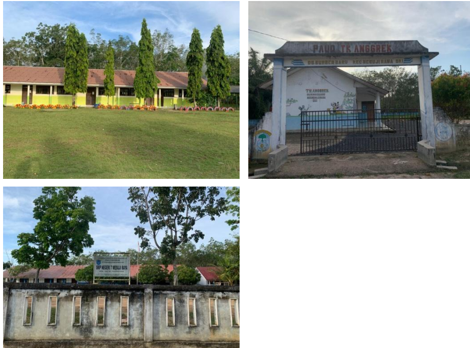
Gambar 7 : Fasilitas pendidikan di Desa Sumber Baru