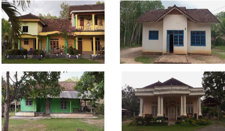
Gambar 9 : Kondisi rumah responden