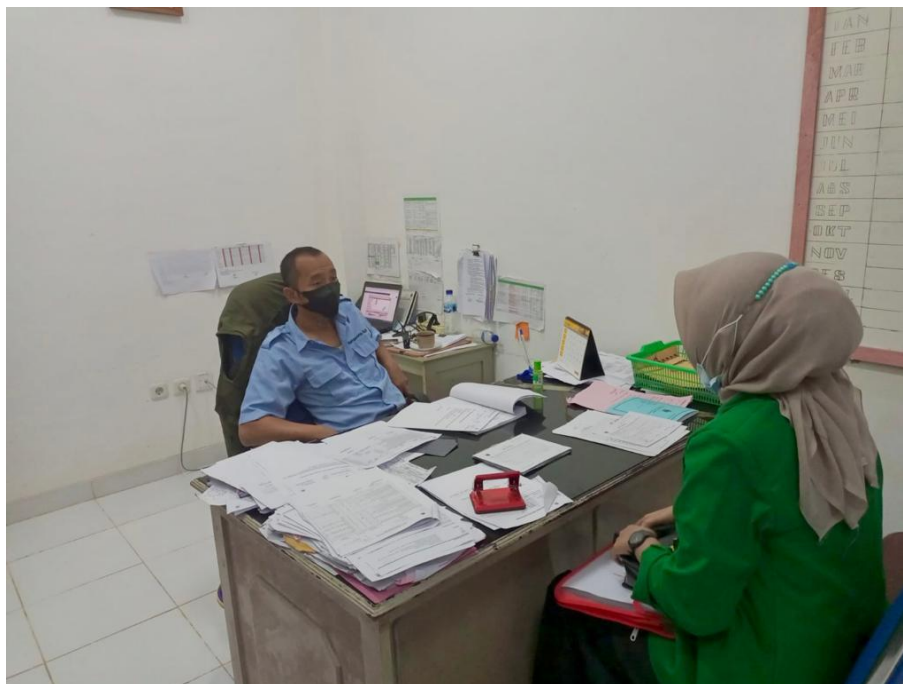
Gambar 2 : Wawancara peneliti dengan KTU PT. Aek Tarum Kebun Belida