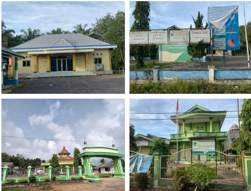
Gambar 6 : Sarana dan Prasarana Desa Sumber Baru