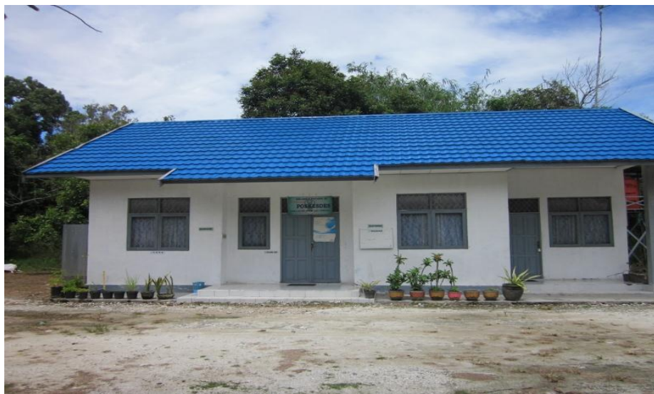
Gambar 8. Fasilitas kesehatan masyarakat di Desa Sumber Baru