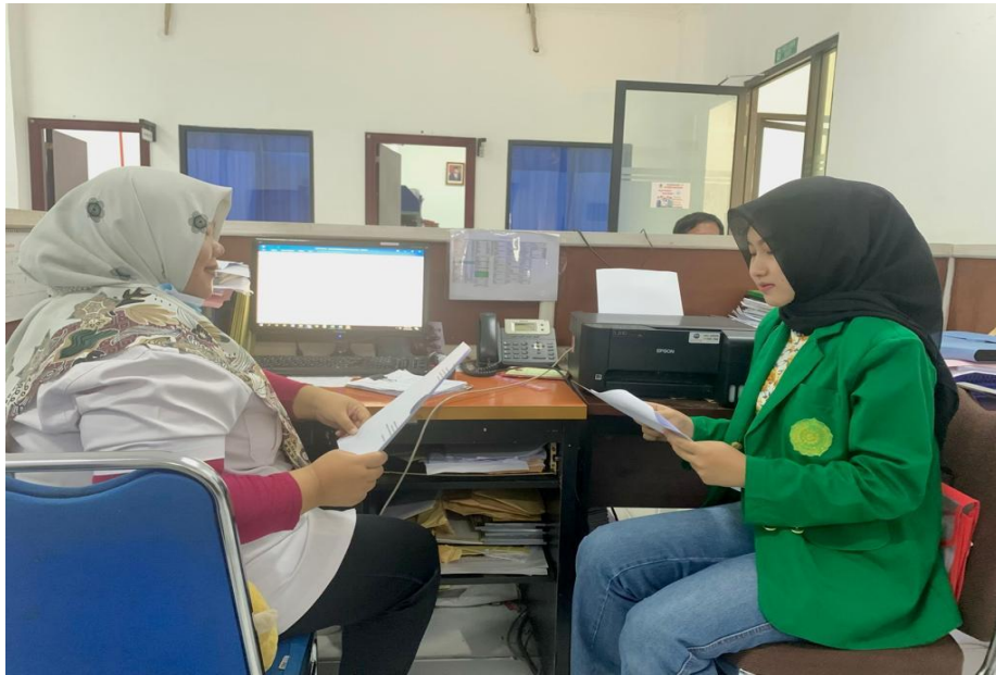
Gambar 5 : Wawancara peneliti dengan masyarakat Desa Sumber Baru yang menjadi tenaga kerja di PT. Aek Tarum Kebun.