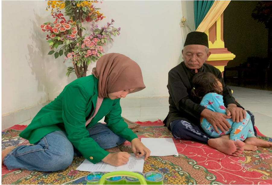
Gambar 3 : Wawancara peneliti dengan Sesepeuh Desa Sumber Baru