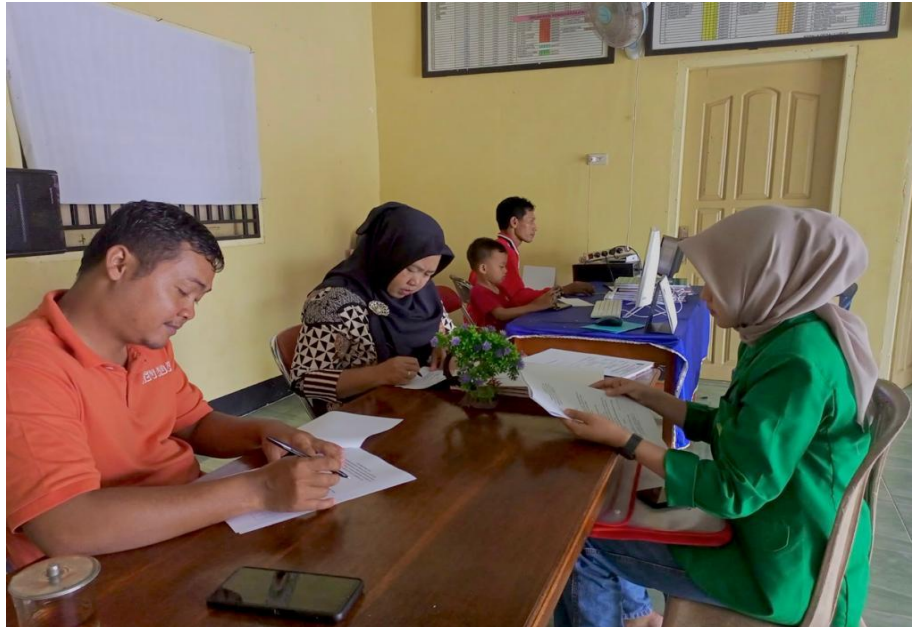
Gambar 1: wawancara peneliti dengan Kepala Desa dan Sekertaris Desa Sumbur Baru