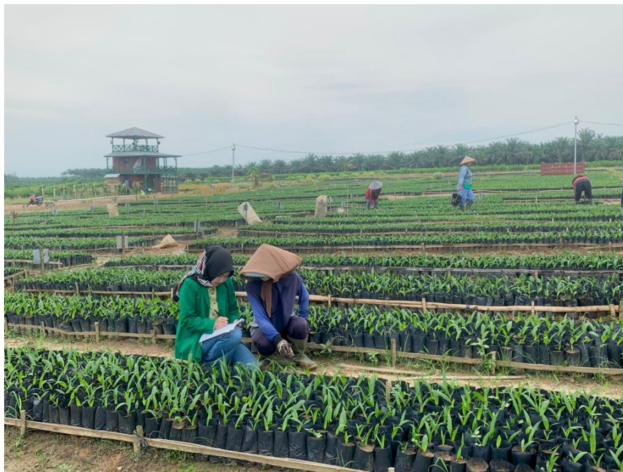
Gambar 4 : Wawancara peneliti dengan masyarakat Desa Sumber Baru yang menjadi tenaga kerja di PT. Aek Tarum Kebun