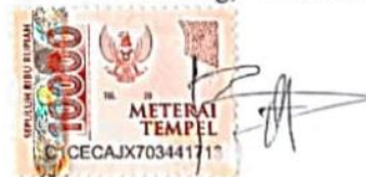
Bella Permata Putri