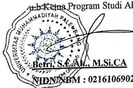
Betri, S.E.Ak., M.Si.CA