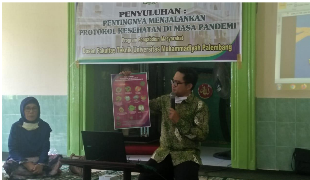
Gambar 4.2. Pemberian Materi Penyuluhan

Pada gambar 4.1 diatas pemateri sedang memberikan penyuluhan kepada masyarakat Kampung Kemas 2 Ulu Palembang. Sedangkan pada gambar 4.3 di bawah ini penyerahan poster kegiatan kepada ketua RT 08 Kelurahan 2 Ulu.