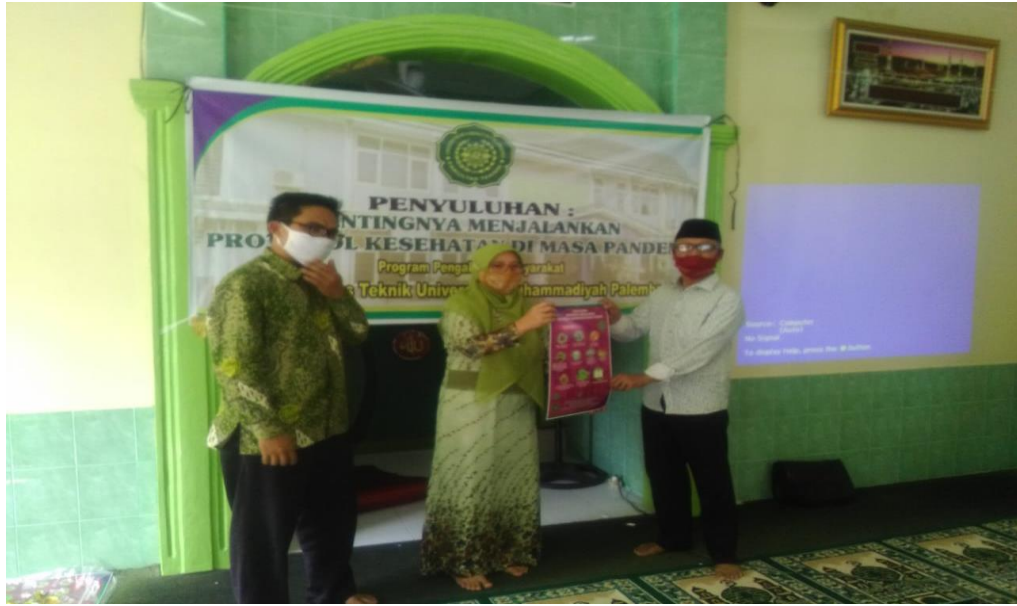
Gambar 4.3 Penyerahan poster kegiatan kepada ketua RT 08