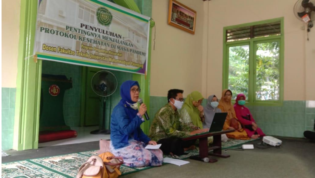
Gambar 4.1 Kata Sambutan Ketua Tim

Pada gambar 4.1 di bawah ini, pembukaan acara penyuluhan, kata sambutan dari ketua tim.