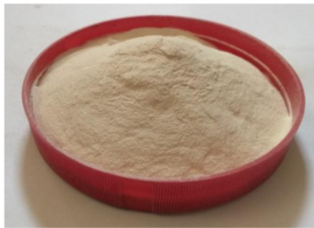
Gambar 1. Katalis RFCCU Al_2O_3

Residu Fluid Catalytic Cracking Unit (RFCCU) Al_2O_3 merupakan material serbuk padat berwarna krim muda yang diperoleh dari Pertamina UP III Plaju, keberadaannya banyak dan dapat digunakan sebagai katalis untuk transesterifikasi minyak jelantah.