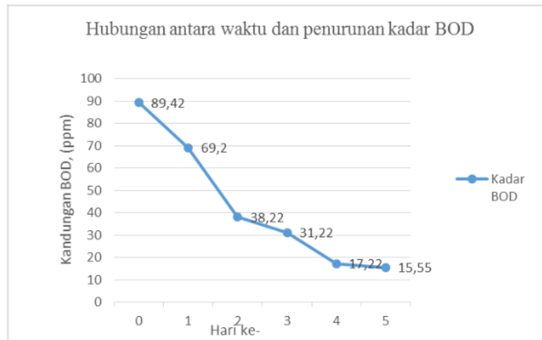
Gambar 1. Grafik hubungan antara waktu dan penurunan kadar BOD.

Semakin lama waktu detensi, maka nilai BOD effluent limbah cair juga semakin kecil. Penurunan BOD dan kenaikan DO air limbah disebabkan oleh adanya keaktifan mikroba yang terdapat pada akar Pistia stratiotes sebagai pemecah bahan organik secara aerob. Penurunan yang relatif mencolok terlihat pada hari ke-2 sampai dengan hari ke-3. Hal ini disebabkan karena aktivitas penyerapan kayu apu semakin tinggi sehingga penyerapan bahan organik oleh akar tumbuhan kayu apu semakin aktif dan nilai BOD turun semakin cepat. Kebutuhan nutrisi mikroba perombak untuk tumbuh dan berkembang biak telah dipenuhi oleh akar tumbuhan kayu apu hasil dari proses penyaringan atau pengikatan bahan organik dan anorganik yang terdapat pada limbah cair. Menurut Sugiharto (1987), penurunan bahan organik dan anorganik dalam air limbah menyebabkan nilai BOD juga semakin menurun, karena semakin rendah kandungan bahan organik dan anorganik dalam limbah cair maka kebutuhan oksigen oleh mikroba untuk mendegradasi atau mengikat bahan organik dan anorganik tersebut juga akan semakin kecil.