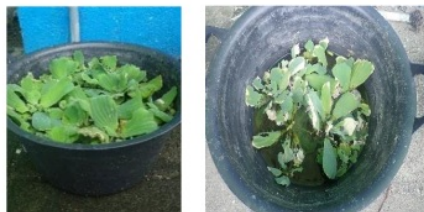
Gambar 4. Perubahan Morfologi daun Pistia stratiotes setelah digunakan sebagai agen fitoremediasi dalam waktu 10 hari.

Menurut Khasanah et al. (2018) Kayu Apu mengalami perubahan yang ditandai dengan kondisi daun yang mulai berwarna kekuningan dan akhirnya sebagian mati. Akar tanaman Kayu Apu juga mengalami kerontokan. Morfologi akar tanaman Kayu Apu yang ditumbuhkan pada medium limbah, mempunyai tekstur yang lunak dan rambut akar sebagian besar terputus karena bagian organ tanaman yang langsung berinteraksi dengan limbah adalah bagian akar. Penyerapan logam berat oleh tanaman dilakukan pertama kali oleh akar.